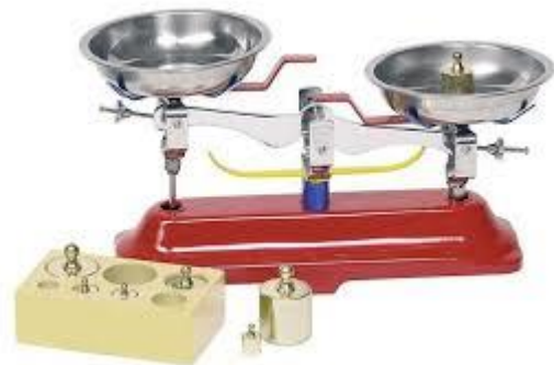
Waga szalkowa z odważnikami